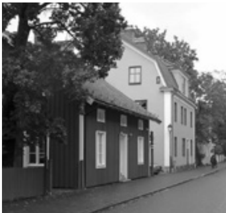
Det gula huset vid Borganäsvägen